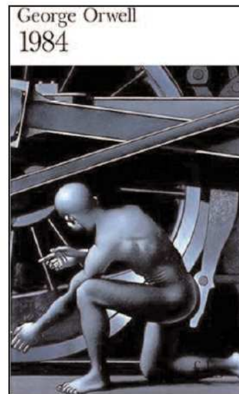
deux éditions françaises de 1984